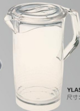
YLAS-4126 80oz水壶 尺寸:直径 20 高 25.5 cm