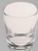
YLAS-4118 14oz矮杯 尺寸:直径 9 高 10 cm