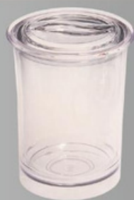
YLAD-5035 酒桶 尺寸:直径 17.5 高 22.3 cm