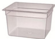
YLAS-4481 长32.4 宽26.4 高19.7cm