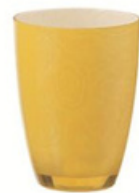
16oz 杯 YLAD-5010 直径 9 高 12 cm