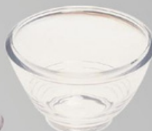
YLAS-4121 小沙拉碗 尺寸:直径 15 高 8 cm