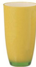
19oz 杯 YLAD-5009 直径 9 高 16 cm