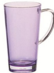
19oz 杯 YLAD-5015P 直径 12 高 16 cm