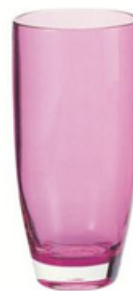
20oz 杯 YLAD-5020 直径 9.5 高 19.7 cm