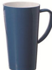
19oz 杯 YLAD-5015BL 直径 12 高 16 cm