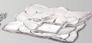
YLOD-6204 雕花水果盘 尺寸:长29 宽29 高3.8cm