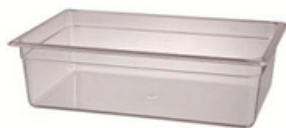
YLAS-4479 长52.8 宽32.3 高14.7cm