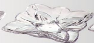
YLOD-6205 雕花水果盘 尺寸:长29 宽29 高3.8cm