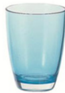
16oz 杯 YLAD-5010-1 直径 9 高 12 cm