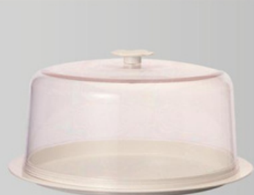
YLAS-4143 蛋糕盒 尺寸:直径 34 高 22 cm