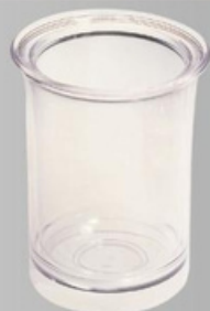
YLAS-4119 冰桶 尺寸:直径 17.5 高 23 cm