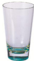
17oz 杯 YLAD-5019-002 直径 9 高 15.7 cm