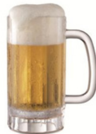
17oz 杯 YLAS-4309 直径 11.5 高 16 cm