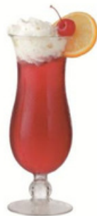
15oz 杯 YLAS-4443 直径 7.5 高 20.5 cm