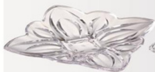
YLOD-6206 雕花水果盘 尺寸:长29 宽29 高3.8cm