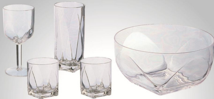
YLAS-4024 大沙拉碗 尺寸:直径25 高12 cm